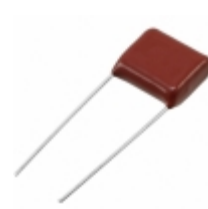
ECQ-E2125JF3 Panasonic Electronic Components CAP FILM 1.2UF 5% 250VDC RADIAL