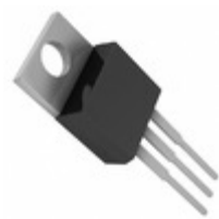
LT1084CT-3.3#PBF ADI (Analog Devices, Inc.) IC REG LINEAR 3.3V 5A TO220-3