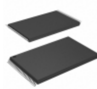
SST38VF6403-90-5I-EKE Microchip Technology IC FLASH 64MBIT 90NS 48TSOP