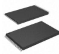
SST38VF6403-90-5C-EKE Microchip Technology IC FLASH 64MBIT 90NS 48TSOP