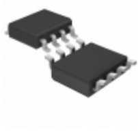
LTC4354IS8#TRPBF Linear Technology IC OR CTRLR SRC SELECT 8SOIC