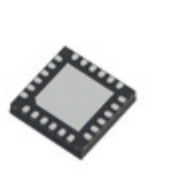
MC10XS3412CHFK NXP USA Inc. IC SWITCH HIGH SIDE QUAD 24PQFN