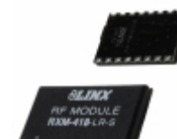
RXM-418-LR Linx Technologies Inc. RECEIVER 418MHZ LR SERIES