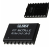
RXM-315-LR Linx Technologies Inc. RECEIVER 315MHZ LR SERIES