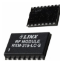
RXM-315-LC-S Linx Technologies Inc. RECEIVER RF 315MHZ SMT