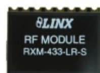
RXM-433-LR Linx Technologies Inc. RECEIVER 433MHZ LR SERIES