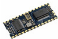
RXM-315-KH3 Linx Technologies Inc. RECEIVER 315MHZ KH SERIES