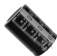
ECE-S1EG223Z Panasonic Electronic Components CAP ALUM 22000UF 20% 25V SNAP