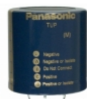
ECE-P2WP821HA Panasonic Electronic Components CAP ALUM 820UF 20% 450V SNAP