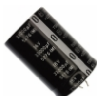
ECE-S1CG333Z Panasonic Electronic Components CAP ALUM 33000UF 20% 16V SNAP