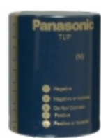
ECE-P2WP122HX Panasonic Electronic Components CAP ALUM 1200UF 20% 450V SNAP