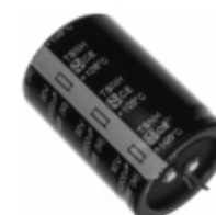
ECE-S1HG103Z Panasonic Electronic Components CAP ALUM 10000UF 20% 50V SNAP