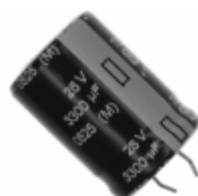
ECE-S1EG332E Panasonic Electronic Components CAP ALUM 3300UF 20% 25V SNAP