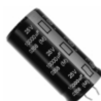
ECE-S1EG103N Panasonic Electronic Components CAP ALUM 10000UF 20% 25V SNAP