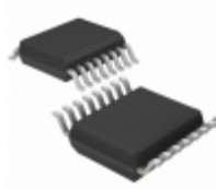
ICL3221CA Intersil IC TXRX SGL RS232 3-5.5V 16SSOP