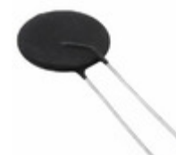
ICL321R030-01 Honeywell Sensing and Productivity Solutions ICL 1 OHM 20% 30A 32MM