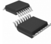
ICL3221CA-T Intersil IC TXRX SGL RS232 3-5.5V 16SSOP