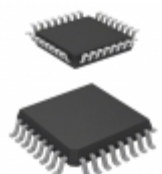
MPC9352FA NXP USA Inc. IC CLOCK CMOS LV 1:11 32-LQFP