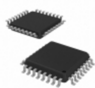
MPC93H52AC IDT, Integrated Device Technology Inc IC CLK GEN ZD 1:11 32-LQFP