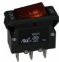
W51-A121B1-20 Agastat Relays / TE Connectivity CIR BRKR THRM 20A 125VAC 50VDC