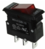
W51-A122B1-10 Agastat Relays / TE Connectivity CIR BRKR THRM 10A 250VAC 50VDC