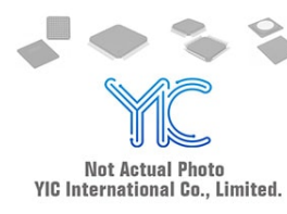
AO4433/TSM4433 Original SOP8