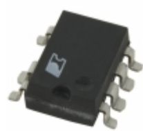
TNY264G Power Integrations IC OFFLINE SWIT OTP OCP HV 8SMD