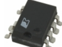
TNY264GN Power Integrations IC OFFLINE SWIT OTP OCP HV 8SMD