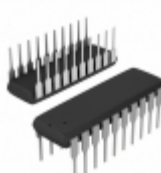
TC14433AEJG Microchip Technology IC ADC 3 1/2 DIGIT 24CDIP