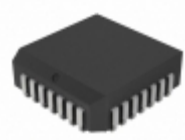
TC14433AELI713 Microchip Technology IC ADC 3 1/2 DIGIT 28PLCC