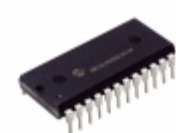
TC14433AEPG Microchip Technology IC ADC 3 1/2 DIGIT 24DIP