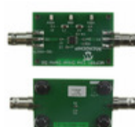
MCP661DM-LD Micrel / Microchip Technology BOARD DEMO MCP661 LINE DRIVER