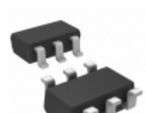
NLVAS4599DFT1G ON Semiconductor IC SWITCH SPDT 6TSOP