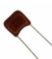
ECQ-B1222JF Panasonic Electronic Components CAP FILM 2200PF 5% 100VDC RADIAL