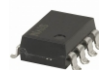
AQW214HLA Panasonic RELAY OPTO DPST W/RESIST 8 SMD