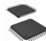
ATF1504ASVL-20AU44 Microchip Technology IC CPLD 64MC 20NS 44TQFP