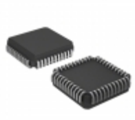
ATF1504ASVL-20JC44 Microchip Technology IC CPLD 64MC 20NS 44PLCC