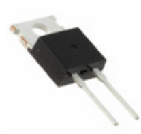
DSEP8-02A IXYS DIODE GEN PURP 200V 8A TO220AC