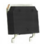
DSEP60-06AT IXYS DIODE GEN PURP 600V 60A TO268AA