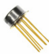
AMP03FJZ Analog Devices Inc. IC OPAMP DIFF 3MHZ TO99-8