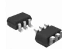
NC7SZ11P6X Fairchild/ON Semiconductor IC GATE AND 1CH 3-INP SC-70-6