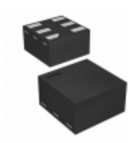
NC7SZ125FHX Fairchild/ON Semiconductor IC BUFFER UHS 3-STATE 6-MICROPAK