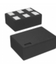
NC7SZ11L6X AMI Semiconductor / ON Semiconductor IC GATE AND 1CH 3-INP 6MICROPAK