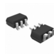
NC7SZ11P6X AMI Semiconductor / ON Semiconductor IC GATE AND 1CH 3-INP SC70-6