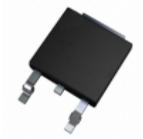
AN7712SP-E1 Panasonic Electronic Components IC REG LDO 12V 1.2A SP3SUA