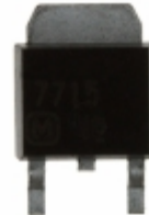
AN7715SP-E1 Panasonic Electronic Components IC REG LDO 15V 1.2A SP3SUA