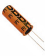
476TXK400M Illinois Capacitor CAP ALUM 47UF 20% 400V RADIAL