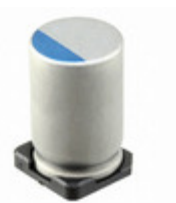
476UVG020MFF Illinois Capacitor CAP ALUM POLY 47UF 20% 20V SMD