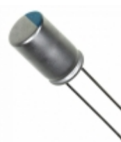
476ULG020MFF Illinois Capacitor CAP ALUM POLY 47UF 20% 20V T/H