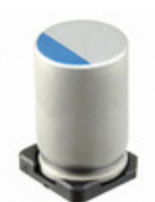
476UVG025MEW Illinois Capacitor CAP ALUM POLY 47UF 20% 25V SMD