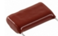
ECW-HC3F822JD Panasonic Electronic Components CAP FILM 8200PF 5% 3KVDC RADIAL