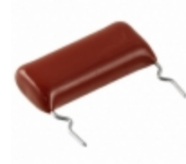
ECW-HC3F562JQ Panasonic Electronic Components CAP FILM 5600PF 5% 3KVDC RADIAL