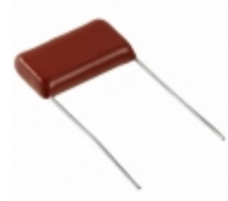
ECW-HC3F822J Panasonic Electronic Components CAP FILM 8200PF 5% 3KVDC RADIAL