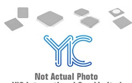
PIC16C57T-XT/SO199 MIC MIC SOP-0.72-28