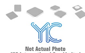
PIC16C588B Microchip PIC16C588B Microchip