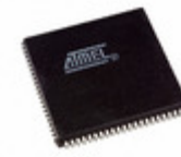
ATF1508ASVL-20JC84 Microchip Technology IC CPLD 128MC 20NS 84PLCC