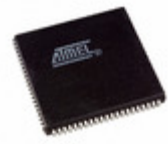
ATF1508ASV-15JU84 Microchip Technology IC CPLD 128MC 15NS 84PLCC