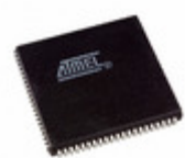
ATF1508ASVL-20JI84 Microchip Technology IC CPLD 128MC 20NS 84PLCC