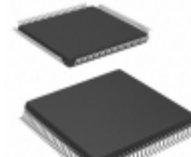
ATF1508ASVL-20AU100 Microchip Technology IC CPLD 128MC 20NS 100TQFP