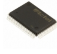
A40MX04-PQ100M Microsemi Corporation IC FPGA 69 I/O 100QFP