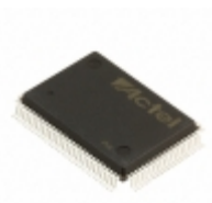
A40MX04-PQ100I Microsemi Corporation IC FPGA 69 I/O 100QFP