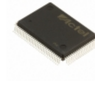
A40MX04-PQ100A Microsemi Corporation IC FPGA 69 I/O 100QFP