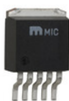
MIC39501-1.8BU Microchip Technology IC REG LDO 1.8V 5A TO263-5