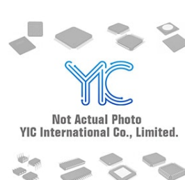
MIC39500-2.5WU TR MICREL MIC39500-2.5WU TR MICREL