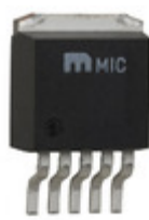
MIC39501-2.5BU Microchip Technology IC REG LDO 2.5V 5A TO263-5