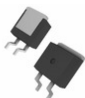
IXBA14N300HV IXYS REVERSE CONDUCTING IGBT