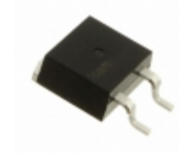
IXBA16N170AHV IXYS Corporation REVERSE CONDUCTING IGBT