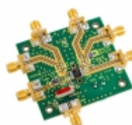
AD8346-EVALZ ADI (Analog Devices, Inc.) EVAL BOARD FOR AD8346