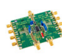
AD8347-EVALZ ADI (Analog Devices, Inc.) BOARD EVAL FOR AD8347