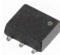
MTM761110LBF Panasonic Electronic Components MOSFET P-CH 12V 4A WSMINI6