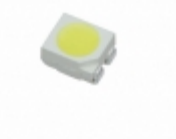
CLA2A-WKW-CYBZ0453 Cree Inc. LED COOL WHITE DIFF 4PLCC SMD