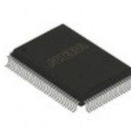
EPM7128SQI100-10N Altera IC CPLD 128MC 10NS 100QFP