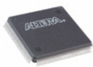
EPM7128SQI160-10N Altera IC CPLD 128MC 10NS 160QFP