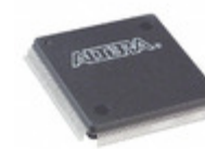
EPM7128SQI160-10 Altera IC CPLD 128MC 10NS 160QFP