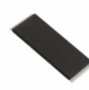
IS65C1024AL-45TLA3-TR ISSI, Integrated Silicon Solution Inc IC SRAM 1MBIT 45NS 32TSOP