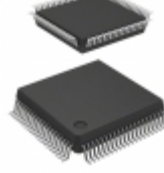
PEF 20550 H V2.1 Infineon Technologies IC CONTROLLER PCM 80MQFP