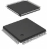
PEF 20571 F V3.1 Infineon Technologies IC CONTROLLER PCM 100TQFP