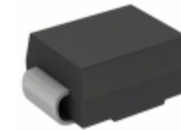
CEFB202-G Comchip Technology DIODE GEN PURP 100V 2A DO214AA