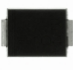
CEFB103-G Comchip Technology DIODE GEN PURP 200V 1A DO214AA