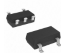
RT9715BGBG Richtek USA Inc. IC PWR SWITCH USB 2A SOT23-5