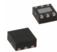
MIC5232-2.8YML-TR Microchip Technology IC REG LDO 2.8V 10MA 6MLF