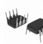
ADM805LANZ Analog Devices Inc. IC SUPERVISOR MPU 4.65V WD 8DIP