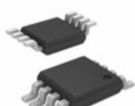
MIC5201-3.0YMM-TR Microchip Technology IC REG LDO 3V 0.2A 8MSOP