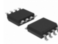
MIC5201-3.0BM-TR Microchip Technology IC REG LDO 3V 0.2A 8SOIC