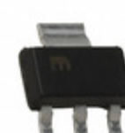
MIC5201-3.0BS Microchip Technology IC REG LDO 3V 0.2A SOT223