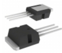
STPS40M120CR STMicroelectronics DIODE ARRAY SCHOTTKY 120V I2PAK