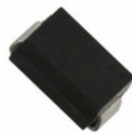
ES1A AMI Semiconductor / ON Semiconductor DIODE GEN PURP 50V 1A SMA