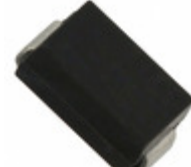
ES1A Fairchild/ON Semiconductor DIODE GEN PURP 50V 1A SMA