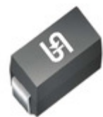
ES1A M2G TSC (Taiwan Semiconductor) DIODE GEN PURP 50V 1A DO214AC