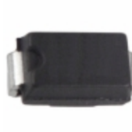
ES1A-13 Diodes Incorporated DIODE GEN PURP 50V 1A SMA