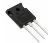
IXFH50N20 IXYS MOSFET N-CH 200V 50A TO-247AD