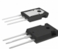
TIP34C STMicroelectronics TRANS PNP 100V 10A TO-247