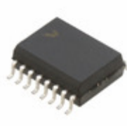
MC145012DW NXP USA Inc. IC SMOKE DETECT WITH I/O 16SOIC