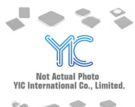
CP2120TT-A1 CHIPHOM CP2120TT-A1 CHIPHOM