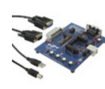
CP2114-EK Energy Micro (Silicon Labs) KIT EVAL CP2114