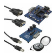
CP2114-PCM1774EK Energy Micro (Silicon Labs) KIT EVAL CP2114-PCM1774