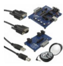
CP2114-CS42L55EK Energy Micro (Silicon Labs) KIT EVAL CP2114-CS42L55