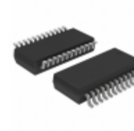
LTC3713EG#TRPBF Linear Technology IC REG CTRLR BUCK/BOOST 24SSOP