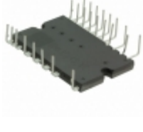
BM63764S-VC Rohm Semiconductor IC IPM 600V IGBT SW 25HSDIP