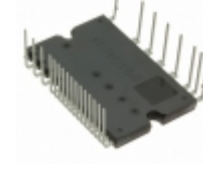
BM63764S-VA Rohm Semiconductor IC IPM 600V IGBT SW 25HSDIP