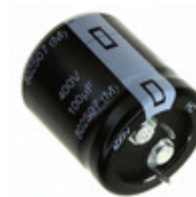
EET-HC2G271BA Panasonic Electronic Components CAP ALUM 270UF 20% 400V SNAP