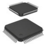
PCF51JU128VLH NXP USA Inc. IC MCU 32BIT 128KB FLASH 64LQFP